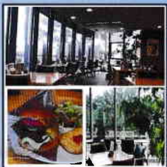
Vol.7 ◆ロケーション抜群、穴場的なカフェ、癒しの場 SUN CAFE