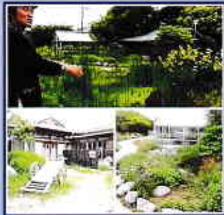
Vol.2 ◆自然あふれる農園で暮らしを楽しく！RIVENDEL