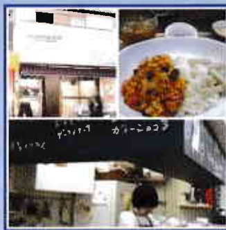
Vol.9 ◆各種レッスンもお子様同伴。歓迎！ mama's café joy