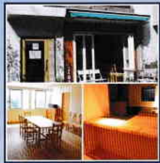
Vol.10 ◆自然素材で赤ちゃんも安心！オーガニック七菜