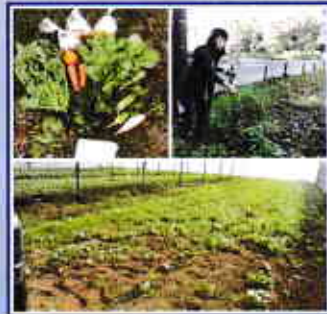
Vol.3 ◆自然栽培のお野菜を生産・販売 (株)女農業道