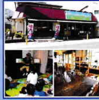
Vol.6 ◆作家さんの作品委託・販売 コミュニティカフェゆめたい