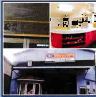
Vol.5 ◆地域に根ざした地元のリフォーム会社(有)スズキ企画