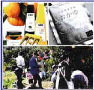
Vol.1 ◆自然資源で商品開発 NPO法人 湘南スタイル